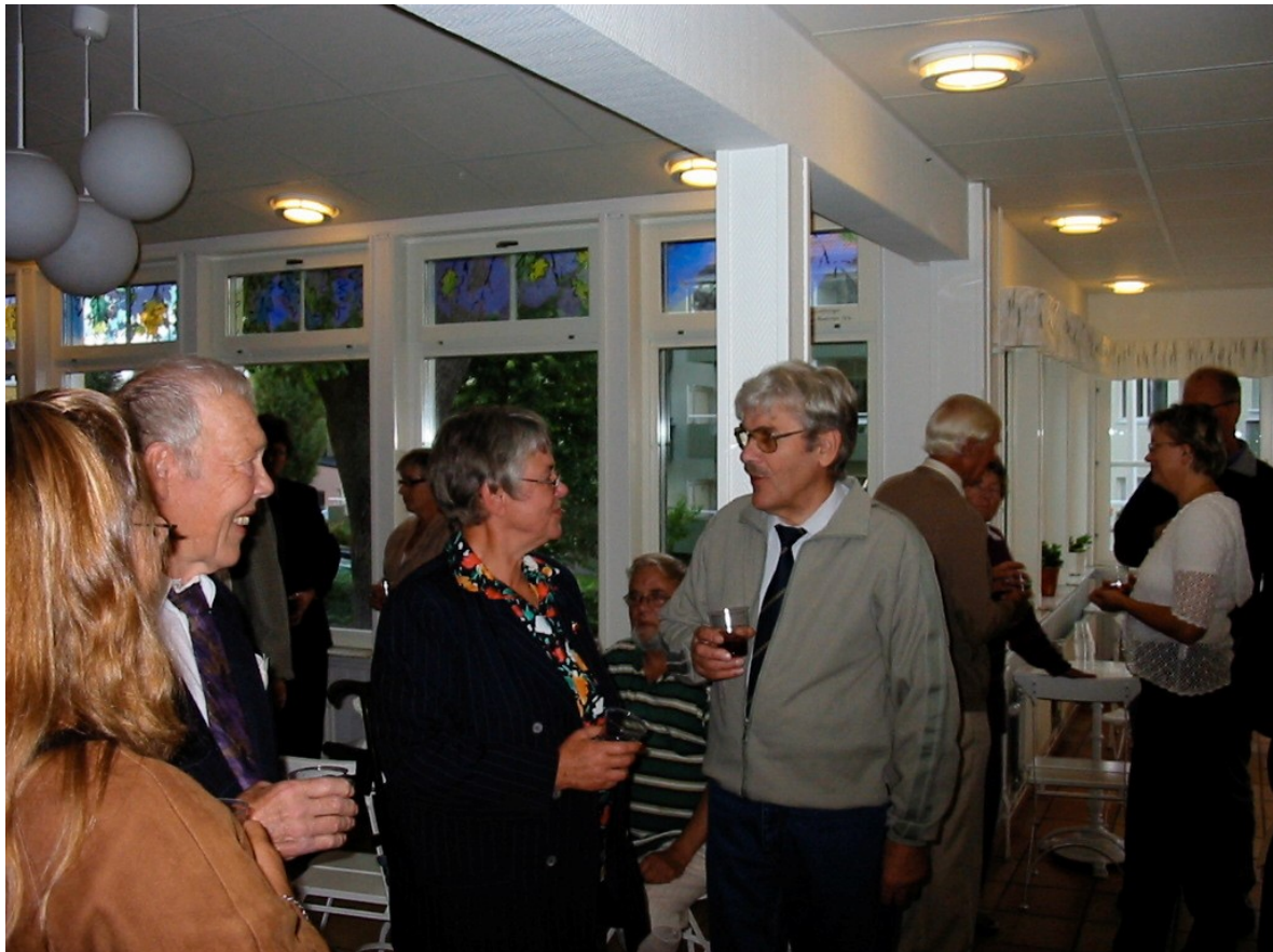
Så roligt hade vi 2003 på 80-års jubileumet