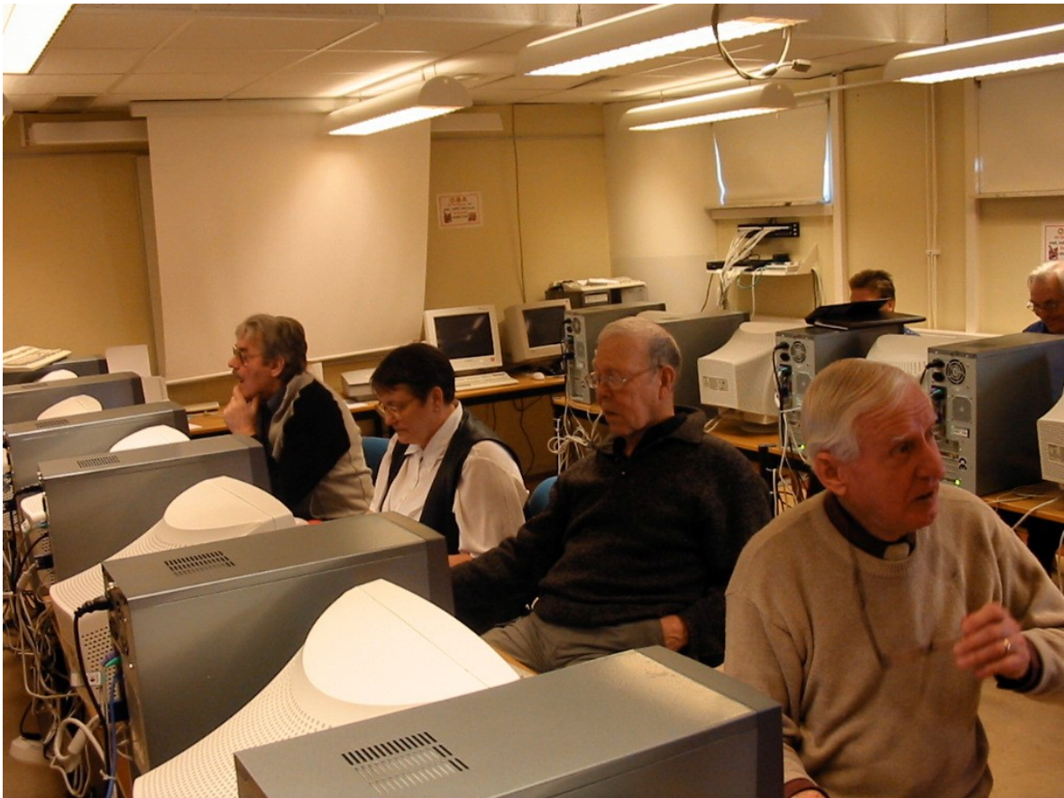
Datakurs i föreningen 2002